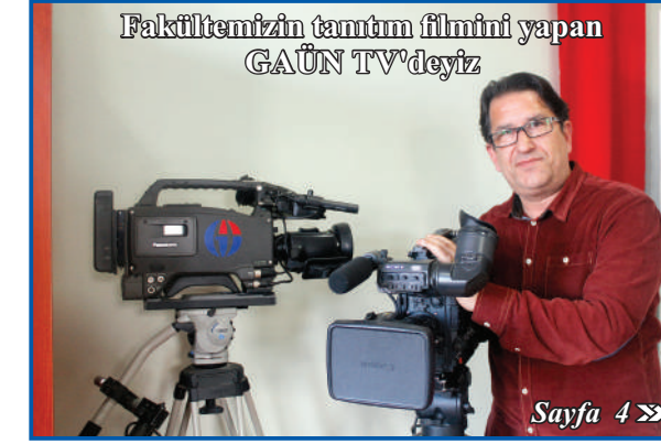
Fakültemizin tamam filmini yapan GAÜN TV'deyiz