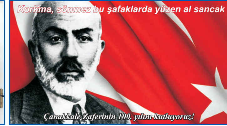
Korkma, sönmöz bu şafaklarda yüzen al sancak

Çanakkale Zaferinin 100. yılını kutluyoruz!