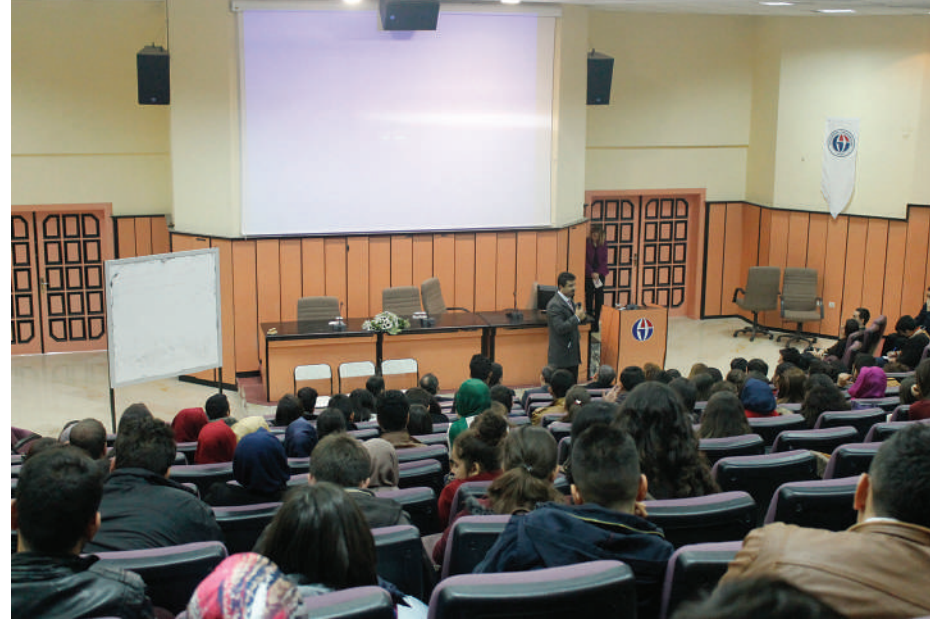
"Uyuşturucu madde kullananların %95'i öncesinden sigara kullananlardır"