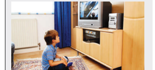
Televizyonun etkisindeki çocuklar tehlikeye açık

Uzman görüşlerine göre, bilinçli bir kullanım olmadığında, televizyon, çocuğun aile ve arkadaşlık ilişkilerini, özgür düşünme yeteneğini, ahlaki ve sosyal gelişimini büyük ölçüde olumsuz yönde etkilemektedir.