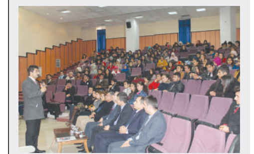
Madde bağımlılığının etkileri ve korunma yolları

"Madde Kullanımının Etkileri Ve Korunma Yolları" konulu konferansta Gaziantep'in sokakta yaşayan çocuklar konusunda üçüncü, eroin olaylarında yedinci, esrarda sekizinci, kokainde beşinci, sentetik uyuşturucuda ise ikinci sırada yer aldığına dikkat çekildi. Konferans kapsamında gençlerin sosyal medya kullanımı konusunda uyuşturucu tacirlerine karşı dikkatli olması gerektiği uyarısı yapıldı.