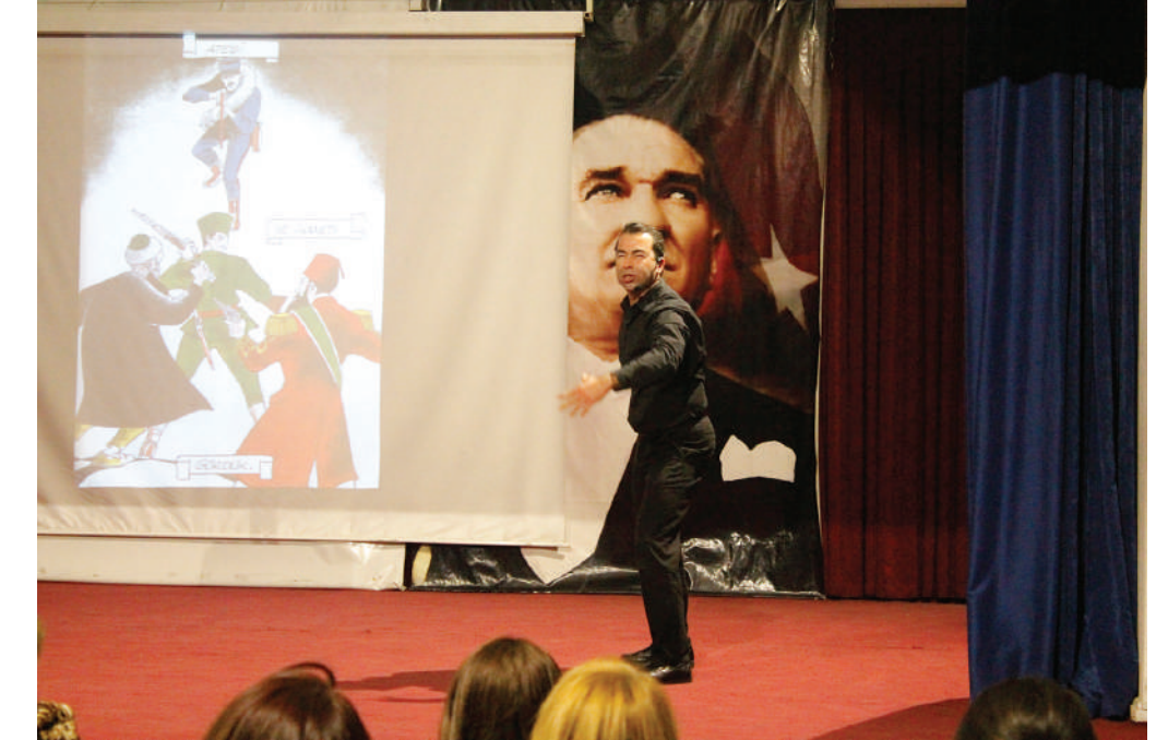
edildiği yıllarda İzmir Hükümet Binası önünde Yunan askerlerinin çektiği fotoğraf da, seyircilerin dikkatini çeken kareler içindedir.

Marşı'nın ardından tarihimizdeki bazı gerçeklere ışık tutan, 250 fotoğraftan oluşan 'Hoş Gelişler Ola' isimli iki perdelik oyunu Utku Erişik tarafından gösterildi. Fotoğrafların içinde izleyicilerin ilgisini en çok çeken kareler, Kurtuluş Savaşı'na ait olanlar oldu. Utku Erişik, dönemin zor şartlarını, ülkenin dış güçler tarafından işgal edildiğini ve zor durumda bırakıldığını fotoğraf kareleriyle izleyicilere aktardı. Özellikle Kurtuluş Savaşı'nın önderi Mustafa Kemal Atatürk'ün o dönemdeki kararlı duruşunu ve o düşünün Türk milletine Kurtuluş Savaşı'nı kazandırdığını hem anlatımıyla hem de görsellerle izleyicilere sundu. Seyircilerin ilgisini çeken bir diğer kare de, düşman donanmasının İstanbul'a demir atması ve aynı şekilde askerlerin işgaliydi. İzmir'in Yunanlılar tarafından işgal