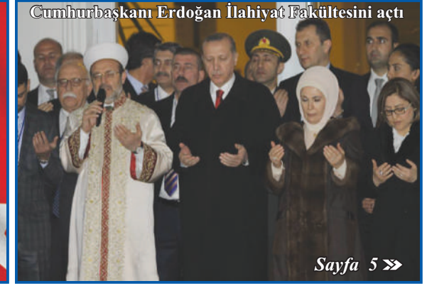
Cumhurbaşkanı Erdoğan İlahiyat Fakültesini açtı

Çanakkale Zaferinin 100. yılını kutluyoruz!