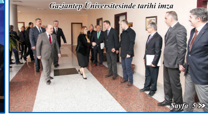
Gaziantep Üniversitesinde tarihi imza