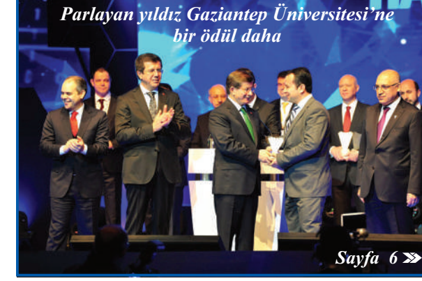
Parlayan yıldız Gaziantep Üniversitesi'ne bir ödül daha

Basın özgürlüğü, tüm demokratik ülkelerde temel özgürlükler arasında yer alan ve anayasal güvenceye sahip bir kavram olarak çıkıyor karşımıza. Anayasamızın 28. maddesindeki "Basın hürdür, sansür edilemez. Basımevi kurmak izin alma ve mali teminat yatırma şartına bağlanamaz" ibaresi de bunu onaylar gibi gözüküyor. Kendi başına düşünsel temellere sahip bir özgürlük kavramı, diğer sivil özgürlükler gibi kavşak noktada dururken, diğer hak ve özgürlüklerin teminatında da kilit noktayı oluşturuyor. Oysaki anayasal bir dayanağa sahip böylesi bir güvence, Uluslararası Sınır Tanımayan Gazeteciler (RSF) örgütünün 2014 Dünya Basın Özgürlüğü Sıralaması'nda Türkiye'yi 180 ülke içerisinde 154. sırada gösteriyor. Basın özgürlüğü sıralamasında savaştan yeni çıkan Irak ve Gambia gibi ülkeler arasında yer alan Türkiye'ye yönelik bu değerlendirmeye, uluslararası algı açısından üzüntü verici görünmektedir. Türkiye'ye yönelik bu algının daha olumlu düzeye çekilmesi ve gazeteciliğin daha özgür bir ortam içerisinde gerçekleştirilebilmesi için çeşitli adımların atılması gerektiği inancını taşıyorum.