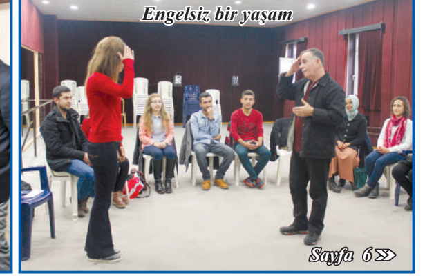
Engelsiz bir yaşam